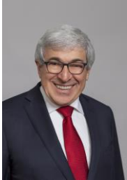
Een bericht van Stanley M. Bergman