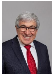
Una carta de Stanley M. Bergman